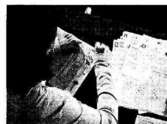
CANGUR. Durante toda la mañana el Polideportivo de Ciutadella estuvo repleto de actividad física y mental