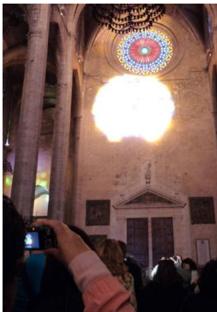
Cámaras en ristre para inmortalizar 'el doble rosetón' o la 'luz de sant Martí'.